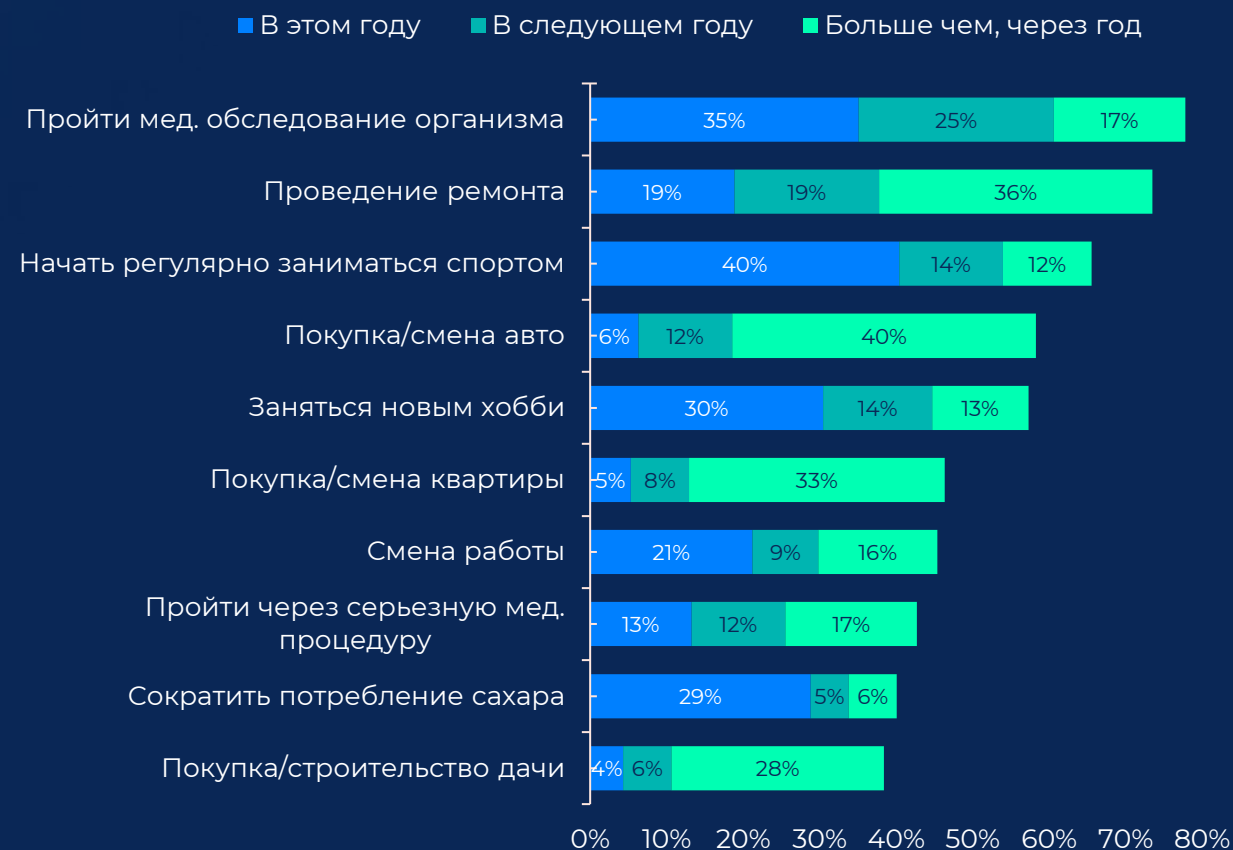
Топ-10 планов россиян 2

46% строят планы на 2023 и дальше vs 50% в 2018 1